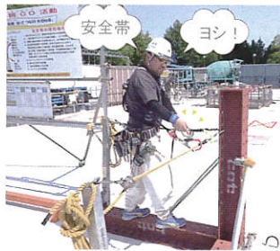
試行ゲートで点検と訓練