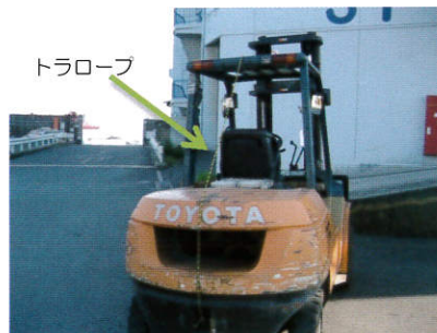
トラローフが見えるまで 振り返り、後方確認