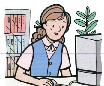
eラーニングも有効