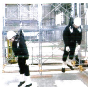
フルハーネス型安全帯に つられる危険体感教育