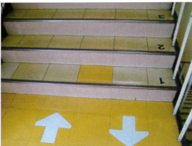
階段の上り下り表示と カウントダウン