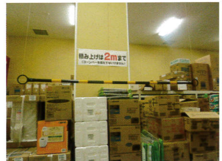
バーをつり下げ、 積み上げ高さを制限