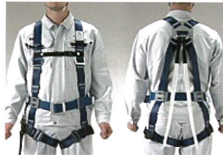
フルハーネス型安全帯